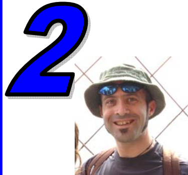
2 N° 2 FOTOTESSERA