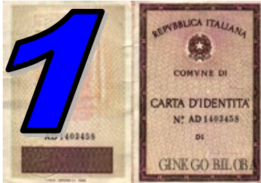
1 N°1 COPIA DOCUMENTO D'IDENTITA'